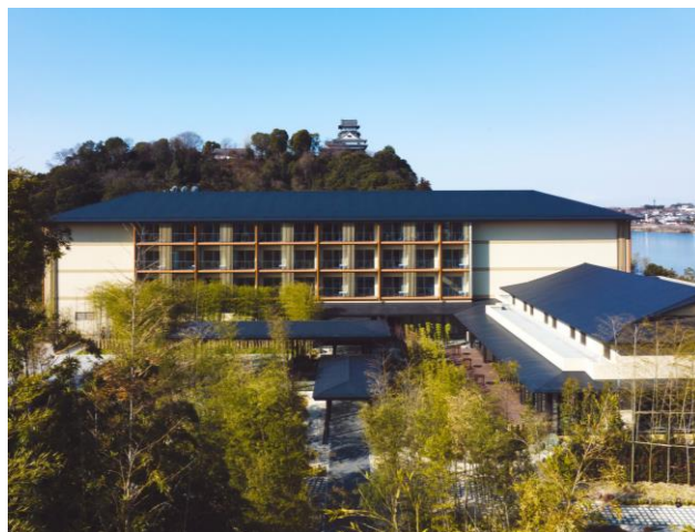
ホテルインディゴ犬山有楽苑